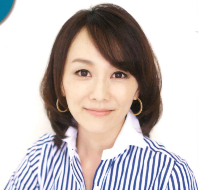
フリーアナウンサー 木佐 彩子